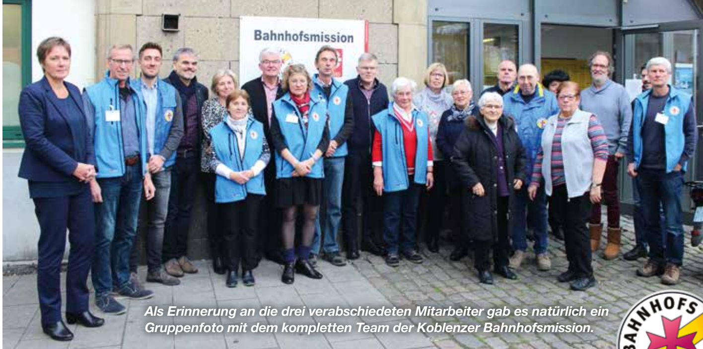
Als Erinnerung an die drei verabschiedeten Mitarbeiter gab es natürlich ein Gruppenfoto mit dem kompletten Team der Koblenzer Bahnhofsmision.