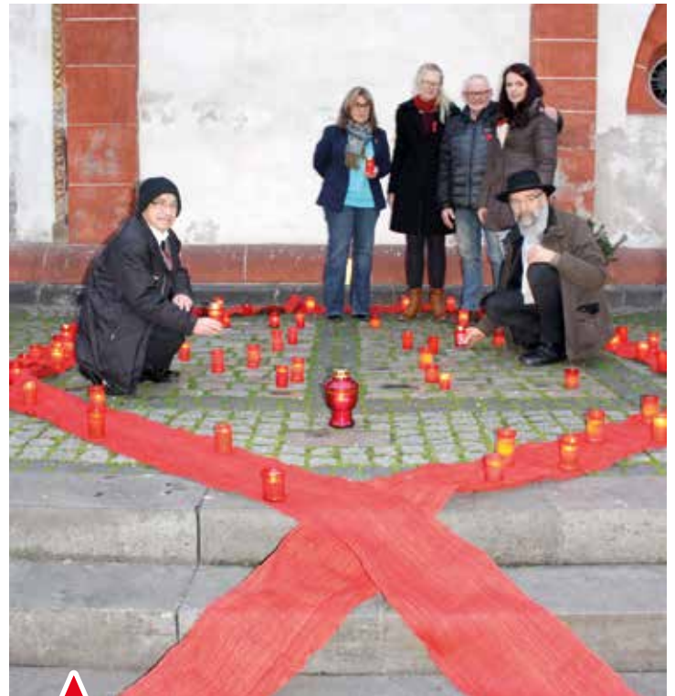
Kerzen als Zeichen der Solidarität im „Denkraum“ an der Nordseite der Liebfrauenkirche: In der Installation sind Steine mit Namen von Menschen, die an AIDS gestorben sind.

Die gemeinsame Veranstaltung des „Rat und Tat e. V.“ (AIDS-Hilfe Koblenz), des Ökumenischen Arbeitskreises City-Pastoral und des Caritasverbandes Koblenz war erneut auch ein Beleg für die gute Zusammenarbeit der beteiligten Institutionen.