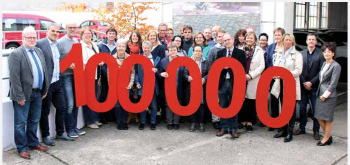
Strahlende Gesichter bei den Mitgliedern der Fachdienstekonferenz. Dank des tollen Ergebnisses der Spendenaktion können nachhaltige Hilfen geleistet und Projekte initiiert werden.

Die Spendengelder kommen der Arbeit mit Senioren, Menschen mit Behinderung, Kindern, Jugendlichen und Familien, Menschen mit Migrationsgeschichte, suchtkranken oder wohnungslosen Menschen zugute, die von der Koblenzer Caritas beraten, unterstützt und begleitet werden.